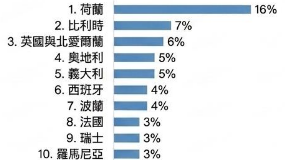
十大國際訪客來源國